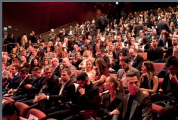
O Teatro do CIEE, em Porto Alegre, ficou lotado para a cerimônia das mais lembradas do RS