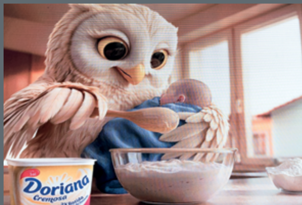
A Doriana lançou sua nova campanha, colocando as “Mães Corujas” como protagonistas