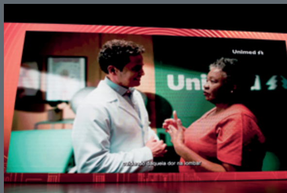
Há mais de três décadas, a Unimed é a marca de Plano de Saúde mais lembrada pelos gaúchos