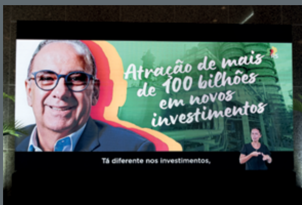
O governo do RS mostrou como o Estado transforma oportunidades em resultados