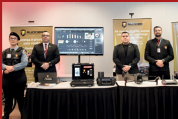
A Rudder, empresa de segurança e vigilância, apresentou seus serviços ao longo do evento