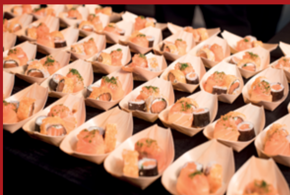
O Sushito ofereceu uma apetitosa experiência gastronômica para o público presente