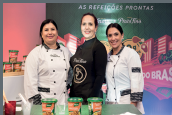
Prato Fino e Knorr se uniram para apresentar o Express: a nova geração do arroz brasileiro