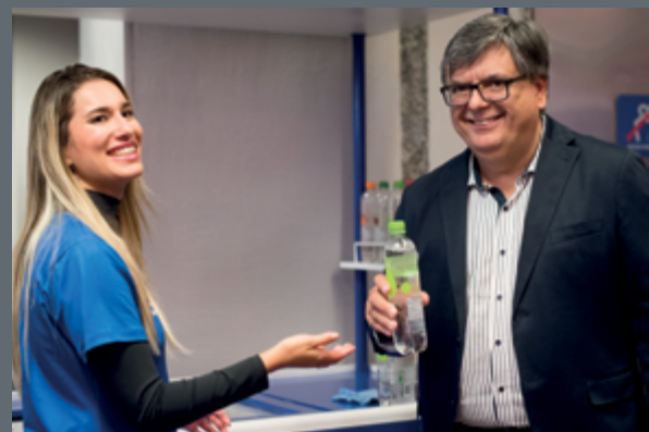
A Crystal, presente entre as marcas mais lembradas em Água Mineral, serviu seu produto