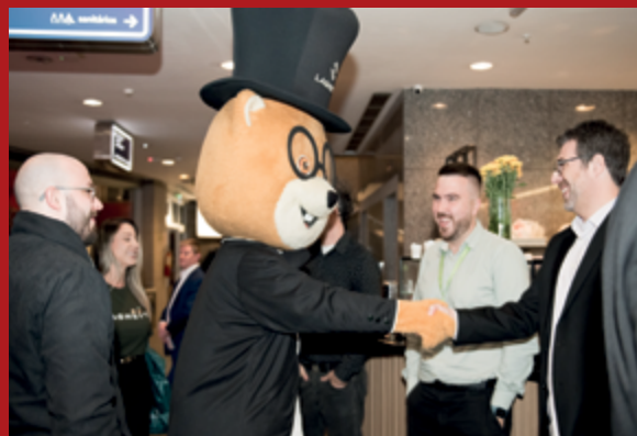
O Sr. Laghettinho, mascote oficial da rede Laghetto Hotéis, interagiu com o público