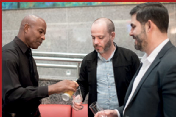
Bebidas da Fruki, entre elas a Água da Pedra, foram servidas na cerimônia de premiação