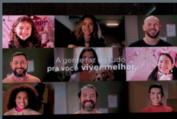
A Guarida consolida-se no Top com uma estratégia institucional voltada ao seu propósito