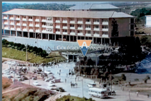
O Colégio Anchieta destacou seu compromisso com a formação integral no evento