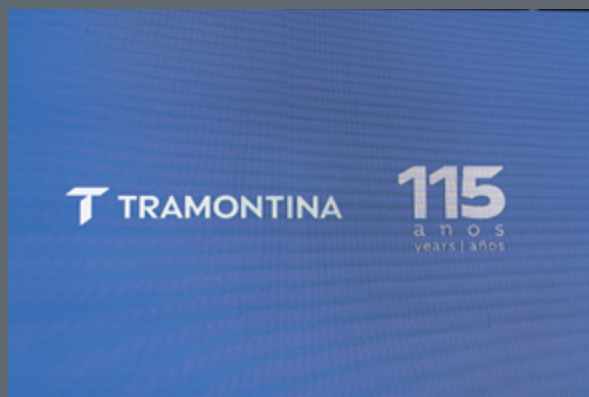
A centenária Tramontina exibiu na cerimônia do Top of Mind sua nova identidade de marca