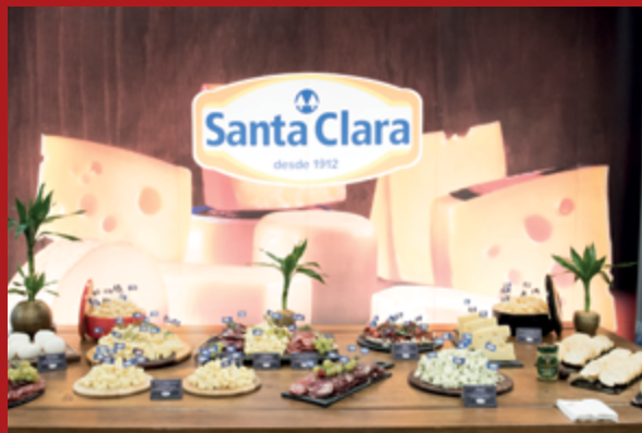
A cooperativa Santa Clara ofertou aos convidados uma farta mesa de queijos deliciosos