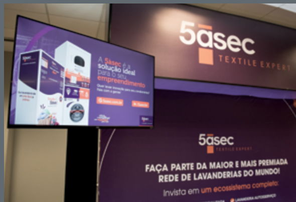
Na estreia de Rede de Lavanderias no Top of Mind Porto Alegre, a 5asec foi a mais lembrada