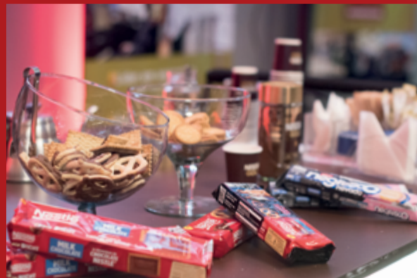
A Nestlé trouxe um mundo de sabores e delícias para os convidados do Top of Mind RS